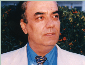
Διονύσης Γάσπαρος, Νομάρχης Ζακύνθου