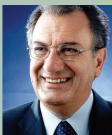
Λεωνίδας Κουρής, Νομάρχης Ανατολικής Αττικής

1. Η Ενίσχυση του Θεσμού της νομαρχιακής αυτοδιοίκησης, ενός θεσμού που δέχεται πολλαπλές πιέσεις από την εποχή της σύστασής του, πιστεύω ότι δεν συνδέεται πρωταρχικά με το εκλογικό σύστημα, το ισχύον ή τα προτεινόμενα. Η ενίσχυση του θεσμού συνδέεται άμεσα και μονοσήμαντα, θα έλεγα, με το δίπτυχο των αρμοδιοτήτων και των πόρων. Δυστυχώς, παρά τα βήματα που έγιναν τελευταία, εξακολουθούμε να απέχουμε σημαντικά από το επίπεδο που όλοι όσοι υπηρετούμε τον θεσμό θα θέλαμε ώστε να είμαστε χρήσιμοι και αποτελεσματικοί για τους συμπολίτες μας. Επομένως το κυρίαρχο για την ενίσχυση του θεσμού δεν είναι το σύστημα των εκλογών, αλλά η επίτευξη ευρείας συναίνεσης στις δράσεις που καλείται κάθε φορά να επιλέξει η νομαρχία για την αντιμετώπιση των μεγάλων